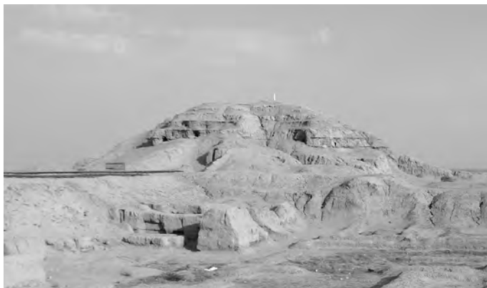
Der Ziggurat oder Weiße Tempel von Uruk, 4000-3000 v. Chr.

Reste einer Tontafel, die 20 neue Zeilen aus dem fünften Kapitel enthielt, die wohl um 600 v. Chr. von einem Neubabylonischen Schreiber verfasst wurden.